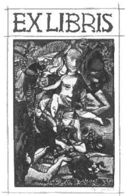
Přeběhy kněžoznaček Josefa Váchala

V roce 2009 byla sestavena a vydána Výro ní zpráva Regionálního muzea v Teplicích za rok 2008 a vyšel katalog k výstav Kn hozna ky Josefa Váchala. Jako doprovodný tišt ný materiál k výstavám z muzejních sbírek byly pro ve ejnost vytvo eny 4 skláda ky: „Kozí dráha“, „Praha 1968 Teplice 1989 - St ety s totalitou“, „Zmizelé Teplice na fotografií“ a „Porcelán s modrými cibulkami“.