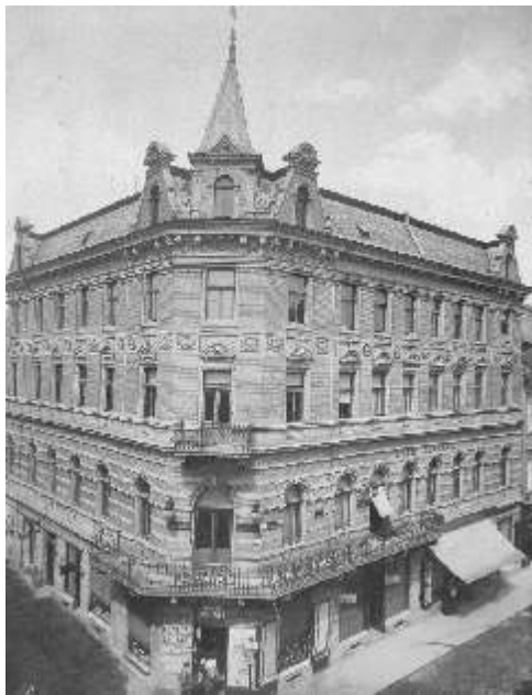
Oblíbená kavárna Central na rohu ulice Dlouhé a U Masných krámů z roku 1911 byla jako v tšina sousedních domů zbořena v 70. letech 20. století

Klášter zanikl po husitských válkách a svetská vrchnost, jejíž vůdce zahájil husitský hejtman Jakoubek z Vesovic a ukončil hraběcí a posléze knížecí rod Clary-Aldringen, jej nejprve přestavěl na tvrz a pak na zámek, který svou definitivní klasicistní podobu získal v roce 1800. Od 16. století se výrazně rozvíjelo lázeňství. Jeho rozmach nezastavil ani velký požár v roce 1793. Naopak, přímě následující výstavby získaly Teplice spolu