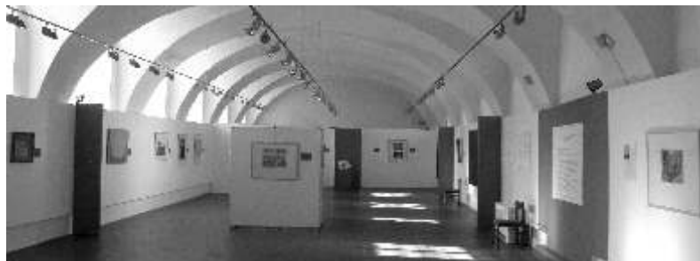
Pohled do výstavní místnosti