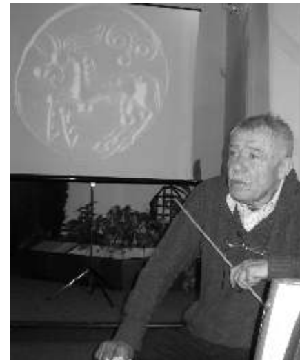
P ednáška KELTOVÉ POD HORAMI

Archeologické oddělení v roce 2014 vypracovalo 165 odborných stanovisek na požádání institucí a investorů, prozkoumalo 78 lokalit a provedlo 7 záchranných archeologických výzkumů.