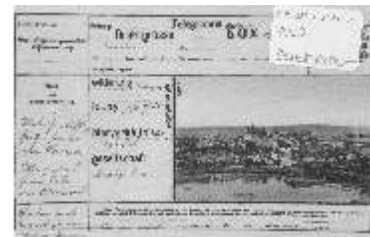
H 18038 Duchcov, pohlednice - telegram s celkovým záběrem na msto, sv. tlotisk barevný, cca 1907