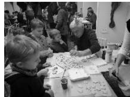
Pe ení cukroví na D TSKÉ VÁNO NÍ DÍLN