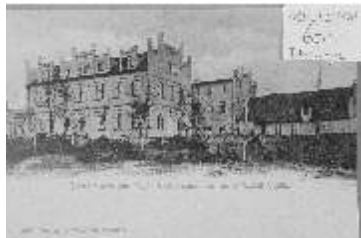
H 18033 Teplice Letná, Biscanovo elektrotechnické ušlíst, sv. tlotisk černobílý, cca 1905