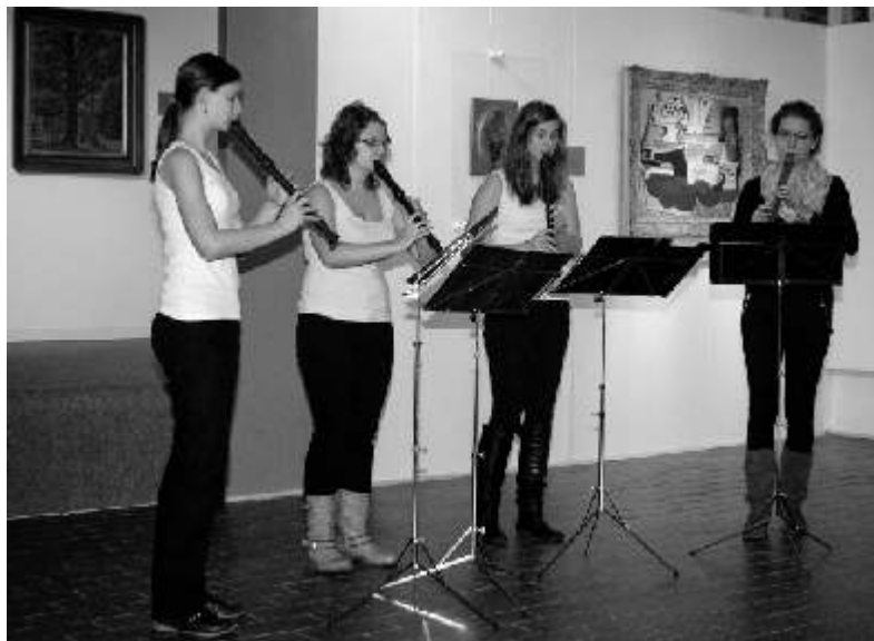
O hudební doprovod p i vernisáži se postarali studentky a studenti Konzervato e Teplice