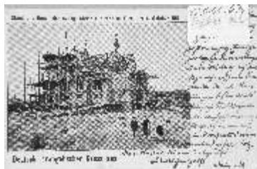
H 18036 Trnovany, výstavba evangelického Kristova (též „Zeleného“) kostela, sv. tlotisk černobílý, 1901