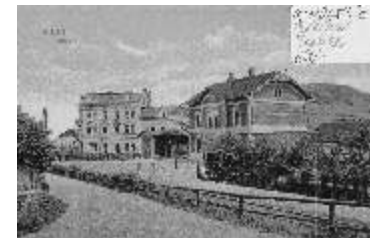
H 18044 Bílina, nádraží, sv. tlotisk barevný, cca 1914