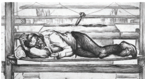
Rudolf Kraus Spící muž